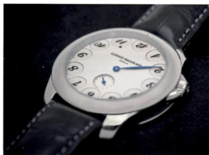
UPSIDE DOWN EN PLATINE