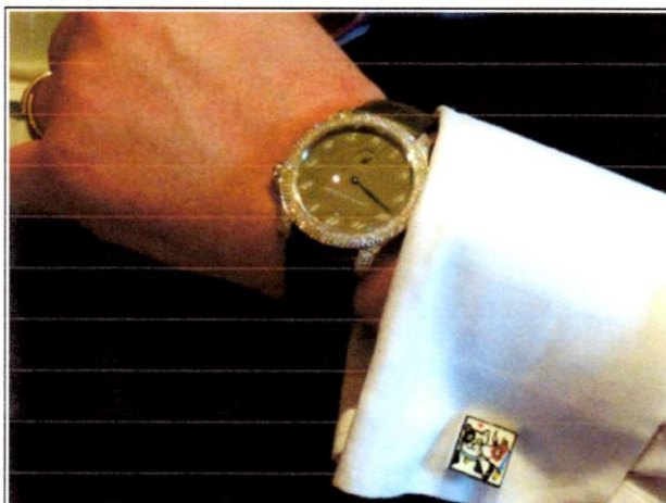
L'Upsidedown en platine, sertie.