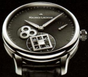
艾美推出钟表业内首创的方形齿轮和三叶草齿轮咬合的全新形式,虽然其单个齿轮也为非等距设计,但是二者咬合所依附的仍然是等距运转原理,因此不属于本文讨论的“凸轮”范畴

从 Ludovic Ballouard 的作品我们可以看出,凸轮是实现指针(或旋转表盘等其他显示方式)非常态运转的得力结构,这一点与计时表中的归零功能有些类似,不过 Ludovic Ballouard 作品中体现出的显示方式更为复杂,且变化周期更为固定和具体。