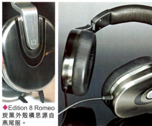
◆Edition 8 Romeo 炭黑外殼構思源自燕尾服。