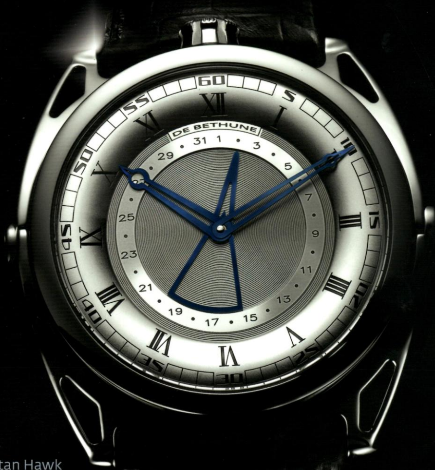
DB27 Titan Hawk